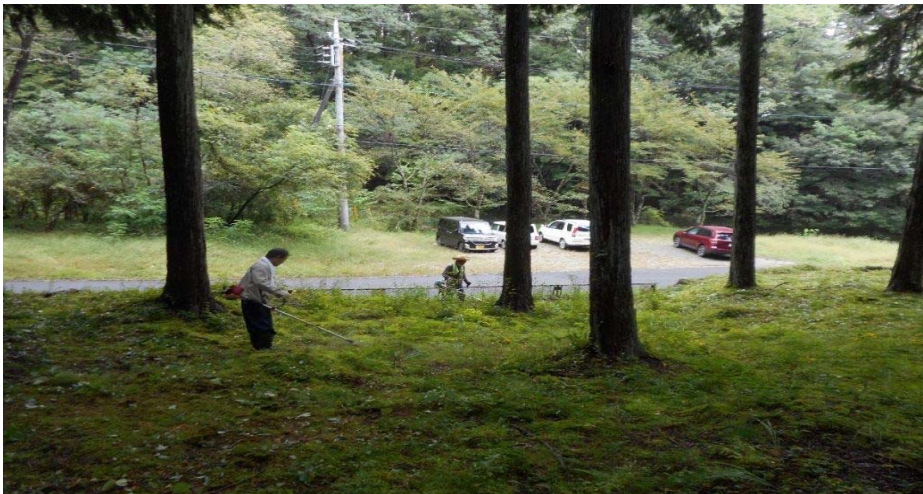
2018/4月、道路側溝落ち葉除去作業中