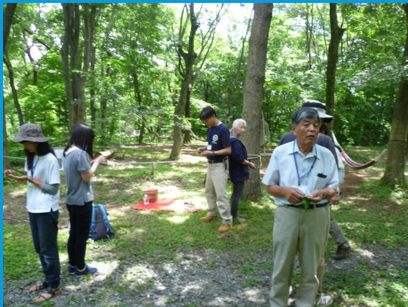
↑オオムラサキセンター 葉っぱじゃんけんの様子