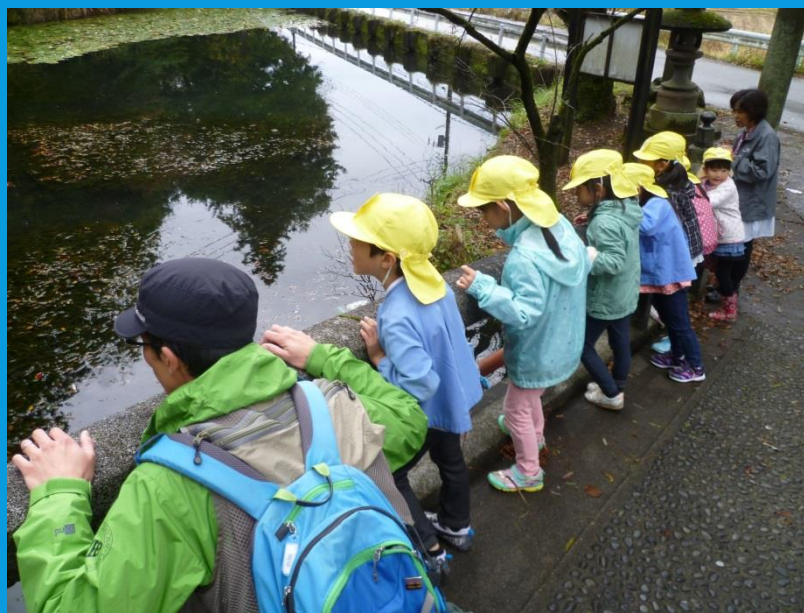
↓ 長坂保育園 神社を訪ねて五感探検隊の様子