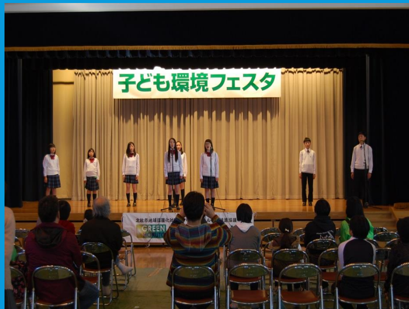
↑ 明野少年少女合唱団