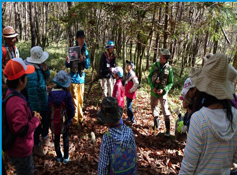
↑八ヶ岳自然ふれあいセンター ヤマネの生態について学んでいる様子