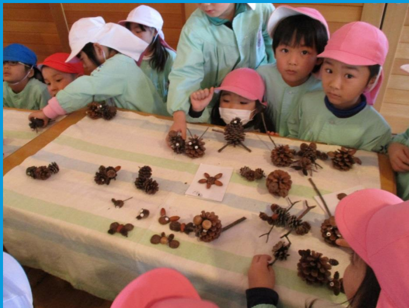
↑ 須玉保育園 森のクラフト作りの様子