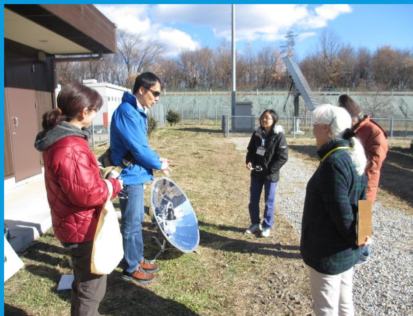
↓北杜サイト エネルギー学習の様子