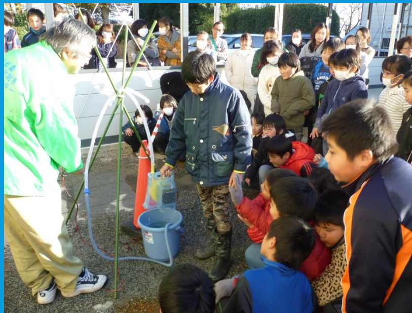
↓須玉小学校 水力発電キットで発電の様子