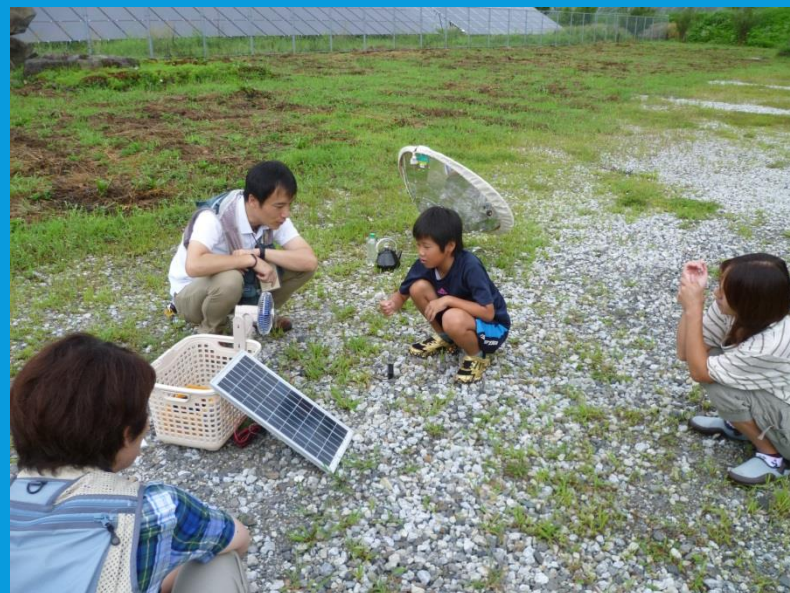
↓北杜サイト 太陽光について学んでいる様子