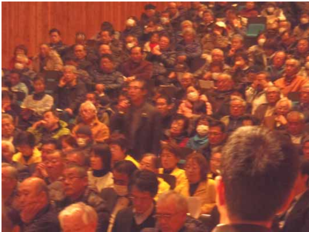
写真-6 参加者からの意見