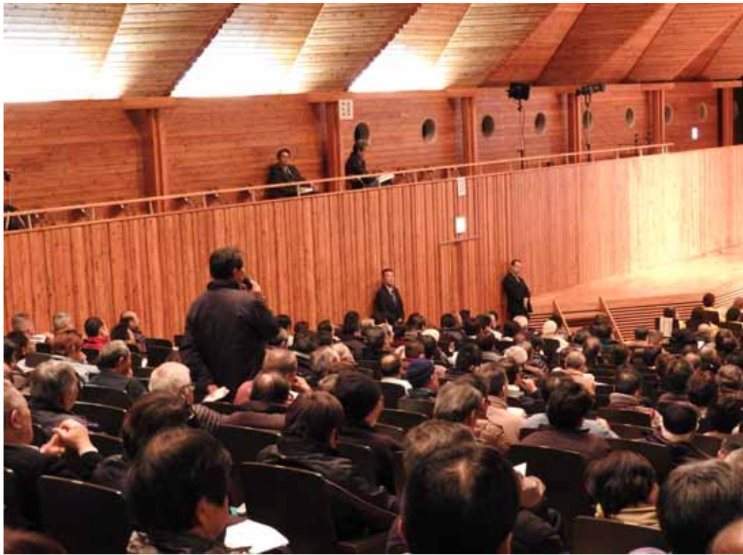
写真-5 参加者からの意見