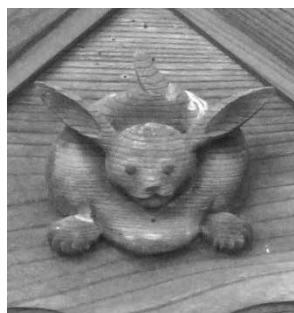
熱那神社のウサギの彫刻（左）と先宮神社のウサギの彫刻（右）