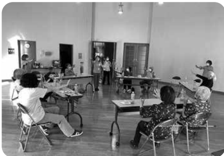
オレンジカフェの様子

※新型コロナウイルス感染拡大防止のため、取り組みを休止している場合があります。事前に地域包括支援センターまでお問い合わせください。