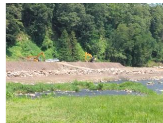
01-02地点(令和5年7月調査時) 01-02地点上流部の工事現場